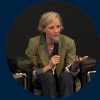
Panel de historias ejemplares Narradas por sus protagonistas

“Nos han gustado mucho las familias invitadas que compartieron sus vivencias, porque nos identificamos con los procesos que están llevando y que con mucho gusto las comparten, es algo muy educativo para nosotros. Este programa ha sido una experiencia muy favorable, es una de las mejores opciones hoy en día en México para mejorar en este proceso de llevar una empresa familiar.”